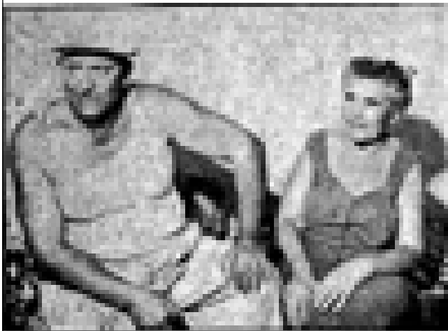
אם ישאלו אותי, אמר לנו אחד מתושבי השכונה, 'אני אגיד לכל מי שמחפש כאן צריף: שרוף את עצמך ואל תבוא. אין לאף אחד מושג כמה קל להיכנס הנה, וכמה קשה לצאת' 10 .

הפעם ביקר מנחם תלמי בשכונה שנמצאה בירושלים. הוא תיאר את הרחוב, שקצהו מבוי סתום, "היא קצה ירושלים העברית" בגבול עם ירדן. "לבית האחרון שברחוב ספר זה קוראים בית-טאנוס [...] בית זה [...] הוא [...] אחת מן החוליות הבולטות ביותר בשרשרת ה'סלאמס' הירושלמי, אחת ממאורות הזוועה המוזנחות ביותר הקיימות לרוב על גבול שטח ההפקר הצר המפריד בין ישראל לירדן". הבית שהיה יעד אסטרטגי של הירדנים אך הם נכשלו בניסיונותיהם לכבוש אותו, תואר כמחורר מכדורים, קירותיו שבורים, חדריו חסרי קירות והוא מלא מפולות אבנים. תלמי כתב שקבוצת עולים חדשים שנקבצו שם מחלקי ארץ שונים "כבשו" את הבית במטרה לחיות במרכז הארץ. משפחות שלמות, בעיקר מקרב עדות המזרח, פלשו לתוך בית הריסות ואשפתות זה [...] בית טאנוס הוא מעין קריאת תיגר נגד אכסיומות מדיציניות, ומעין תערוכת זועות אנטי-סניטארית, המוכיחה בעובדות חיות ומודגשות כי האיזמה שבזוהמות וחוסר מוחלט של מתקנים סניטריים אין להם כל קשר עם מגפות, עם תחלואה, עם תמותה המונית של תינוקות וכדומה, כי מי שמגיע לבית טאנוס ומציץ לתוכו מדמה לרגע כאילו הציץ לבקתותיהם האפלות והמצחינות של הנחותים שבפלחי ארץ היאור.