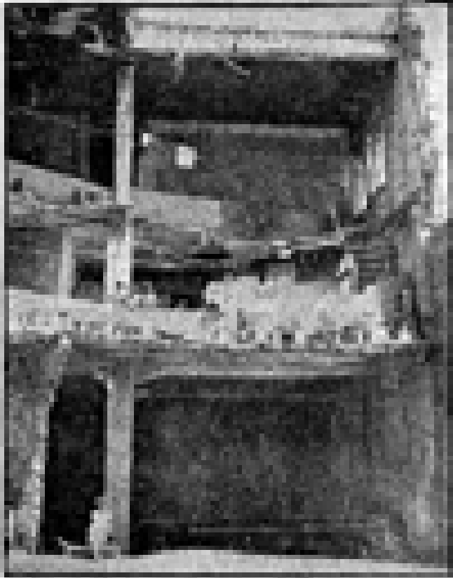
הריסת בית הספר היהודי הראשון בירושלים, 1948.