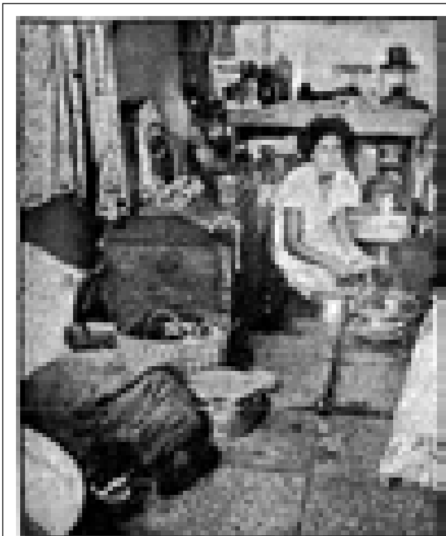
אם ישאלו אותי, אמר לנו אחד מתושבי השכונה, 'אני אגיד לכל מי שמחפש כאן צריף: שרוף את עצמך ואל תבוא. אין לאף אחד מושג כמה קל להיכנס הנה, וכמה קשה לצאת' 10 .