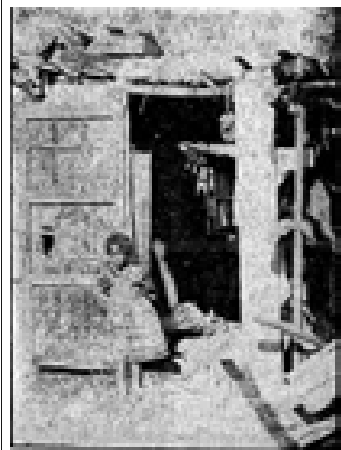
התנאים במשכנות העוני היו בסיסיים מאוד. התמונה מציגה חדר אחד מהמשכנות.

לפי המידע שהתקבל, הוקמו משכנות העוני ברחבי ישראל, וזו הייתה תוצאה של תוכנית ממשלתית להקמת יישובים חדשים. תוכנית זו הייתה חלק מ"תוכנית המעבר" שהתקיימה בשנות ה-50, וכללה מעבר מיישובי הברזל ליישובים חדשים. תוכנית זו הייתה חלק מ"תוכנית המעבר" שהתקיימה בשנות ה-50, וכללה מעבר מיישובי הברזל ליישובים חדשים. תוכנית זו הייתה חלק מ"תוכנית המעבר" שהתקיימה בשנות ה-50, וכללה מעבר מיישובי הברזל ליישובים חדשים.